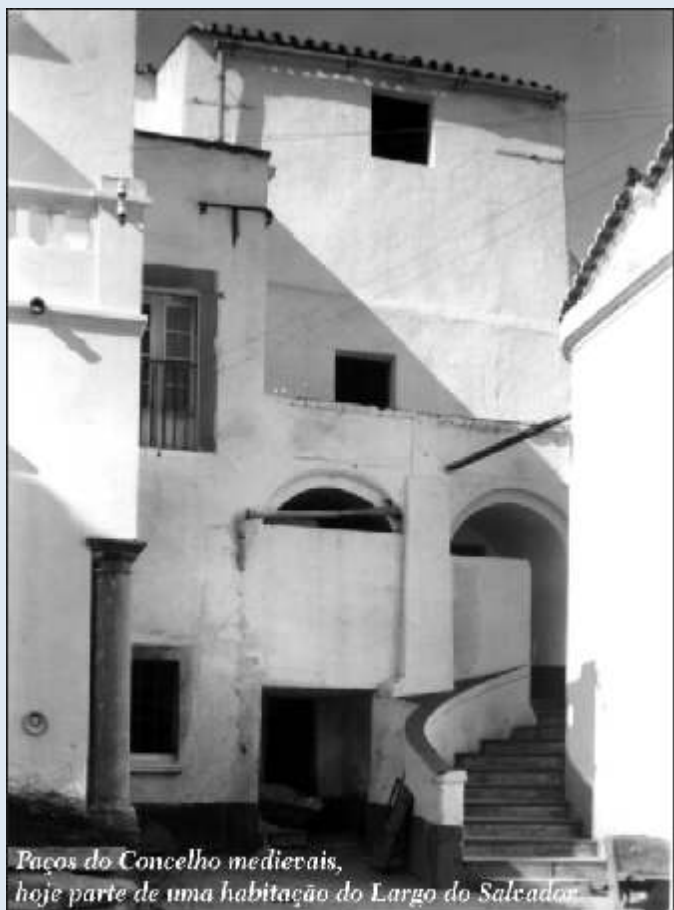
Paços do Concelho medievais, hoje parte de uma habitação do Largo do Salvador