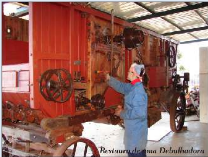
Restauração de uma Debulhadora

Quando as debulhadoras foram introduzidas em Elvas. As primeiras reacções dos trabalhadores rurais, foram de inquietação e negação. A crença generalizada era a de que as máquinas vinham tirar o trabalho e reduzir os salários. No entanto passou-se precisamente o contrário, o trabalho aumentou e como a mão-de-obra requeria especialização, para trabalhar com as máquinas, os salários também aumentaram.