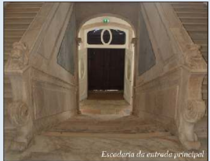
Escadaria da entrada principal