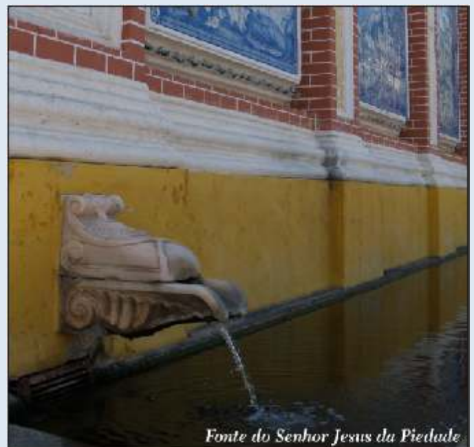
Fonte do Senhor Jesus da Piedade