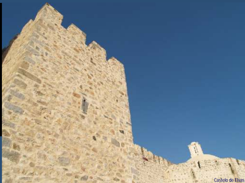
Castelo de Elvas