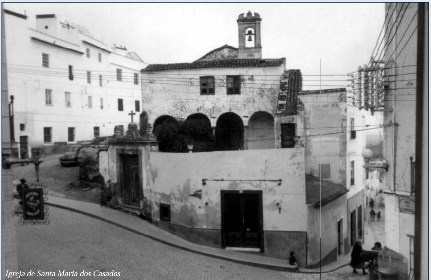
Igreja de Santa Maria dos Casados