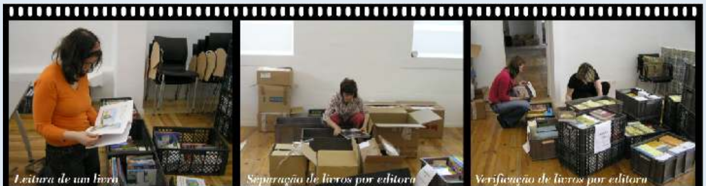
Leitura de um livro

Esta é a altura propícia para o mercado livreiro expor a sua Edição, pois são escassos os eventos ou acções em Portugal relacionadas com este segmento do comércio. É também um marco fundamental para um contacto com o produto-livro por parte do público em geral.